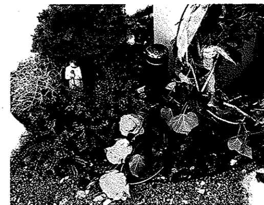
Ein Metallrahmen vor jeder Stela bietet Raum für Grabschmuck.

klein ist. Wir werden das weiter beobachten«, so Eduard Schnell. Die allgemeine Bepflanzung und Pflege der Anlage wird von der Stadt erbracht, so dass die Grabanlage auch bei reduzierter Nutzung gepflegt wirkt. Und wenn einmal alle Stelen belegt sind, so gibt es ganz bestimmt wieder eine brachliegende Fläche, auf der ein weiterer Urnenhain entstehen kann.