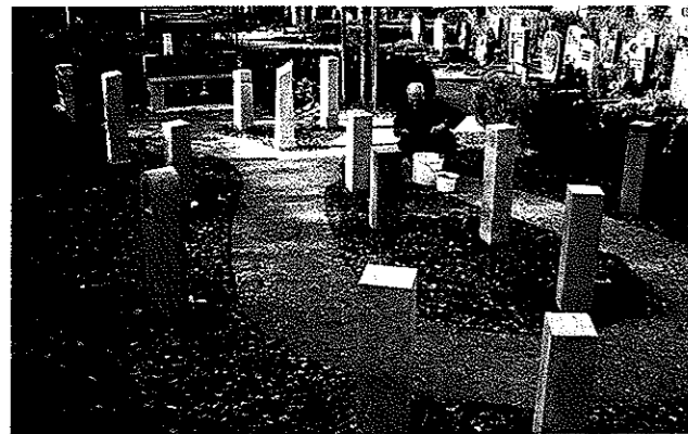
Der Urnenhain ist in den alten Friedhofsbestand integriert.

Einzelne Stelen, die über einer unterirdischen Kammer zur Aufnahme der Urne stehen, gruppieren sich locker um einen geschwungenen Weg in einem Bereich des Friedhofs, der durch Bepflanzung einen geschützten Raum im Gesamttraum Friedhof bildet. Insgesamt sind 44 Bestattungsplätze vorhanden. Die im Erdreich eingelassenen Kammern bieten Platz für ein bis zwei Urnen bei einer Liegezeit von 15 Jahren und sind somit auch als Doppelgrab nutzbar.