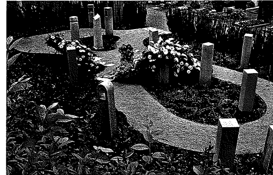
Die Bepflanzung um den Urnenhain schafft eine geschützte Atmosphäre.