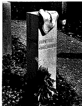
Ganz links: freie Musterstela, rechts: Die Gestaltung der einzelnen Stelen kann unterschiedlich sein – von schlicht bis aufwendig.